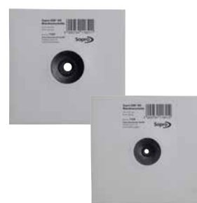
● AEB® HD Tätning- och frikopplingsfolie